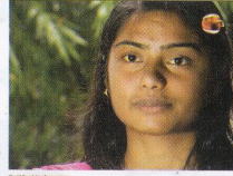
বিস্তারিত তথ্যের জন্য মোবাইলে স্ক্যান করুন: