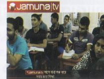
বিস্তারিত তথ্যের জন্য মোবাইলে স্ক্যান করুন: